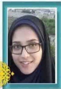
مقام دوم رشته آشنایی با احادیث اهل بیت فاطمه سلحشور